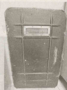
Um escudo foi usado na operação

uma casa, segundo boletim de ocorrência. Durante buscas uma equipe da PM entrou com escudo em uma residência na