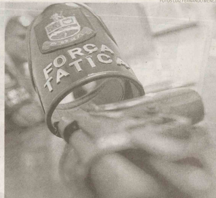
Policiais apreenderam uma pistola com o suspeito que veio a falecer

TIROS A Polícia Militar foi acionada e recebeu a informação de que o trio teria pulado o muro de