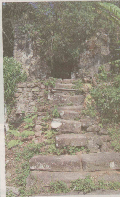
As ruínas do Forte de São Felipe e da Ermida de Santo Antonio fazem parte do patrimônio histórico de Guarujá. A intenção é transformar essa área em um parque arqueológico